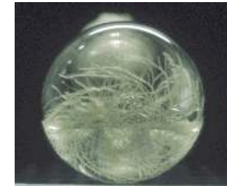
Fig. 2. Cultura de raízes crescendo em meio líquido