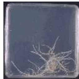
Fig. 1. Cultura de raízes transformadas de cenoura, crescendo em placas de Petri com meio "M"