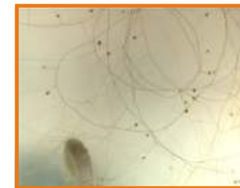
Fig. 4. Desenvolvimento micelial de S.